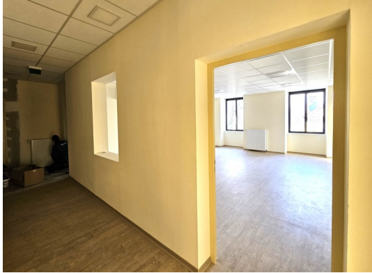
Travaux en cours côté accueil Mairie

(photo: extraction des lauzes à la carrière du Pinel sur le Larzac)