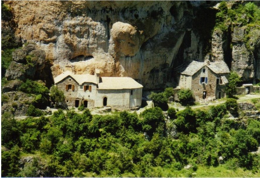
Saint Marcellin, au cœur des falaises