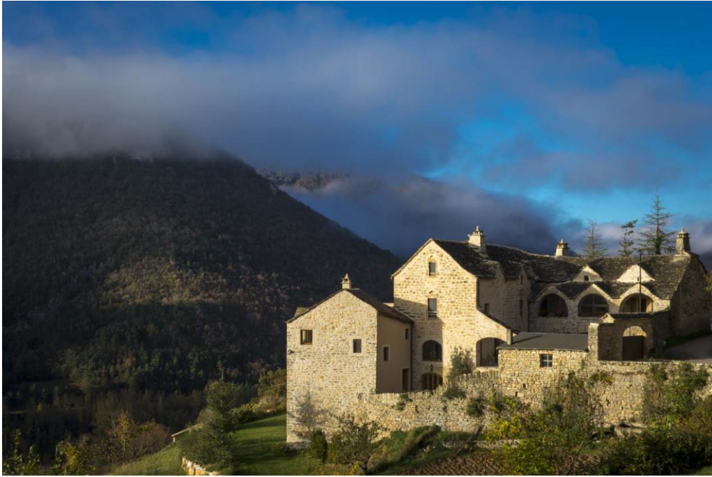
Mostuéjols Architecture Caussenarde