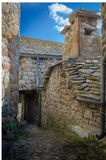
Liaucous, Toitures en Lauze