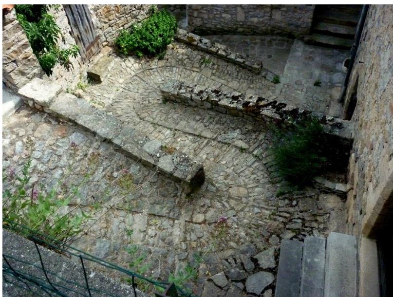
Mostuéjols, une calade