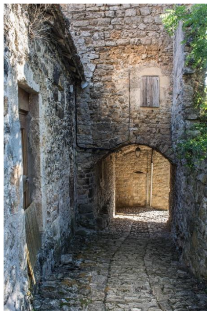
Une calade à Liaucous