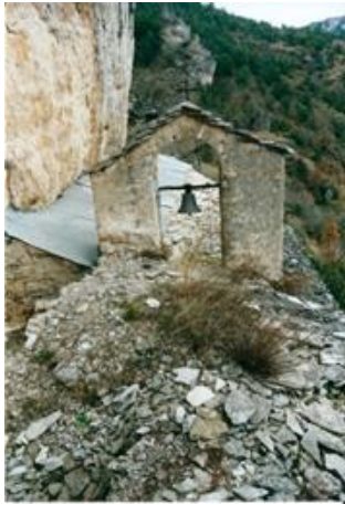
La toiture de la chapelle est très dégradée