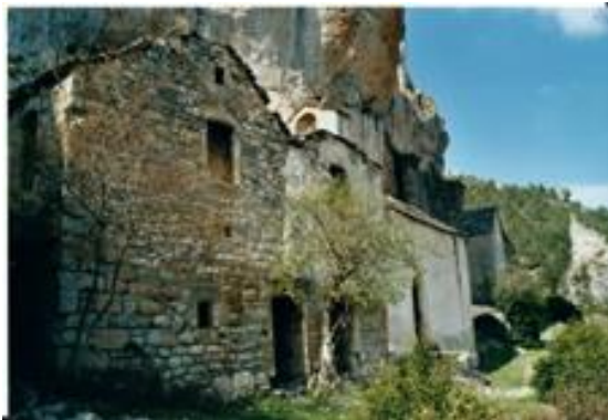
Le prieuré est en mauvais état