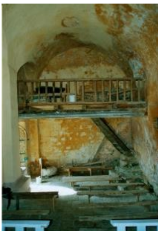
La chapelle avant restauration