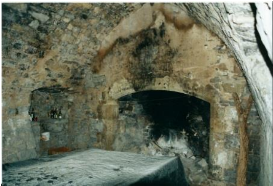
L'intérieur du prieuré avant restauration